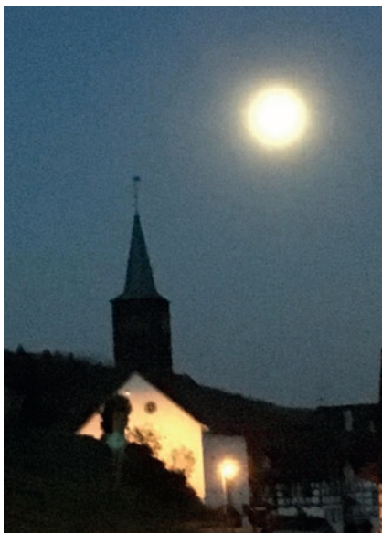
Kirche unterm Vollmond – unscharf, aber schön

Während der Sommerferien verweisen wir auf das Gottesdienstprogramm, welches im Kirchenboten ersichtlich ist oder auf einen der aufgezeichneten Gottesdienste aus dem Kanton SH auf der Homepage der Kantonalkirche www.ref-sh.ch